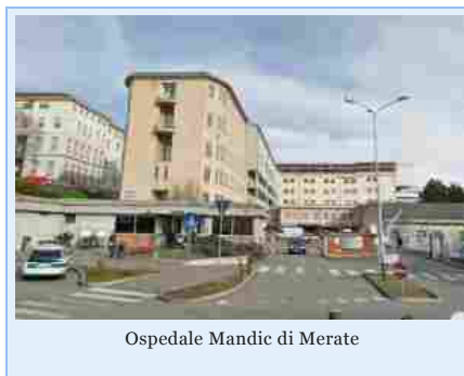
Ospedale Mandic di Merate

MERATE – Verranno attivati, a partire da mercoledì 1 marzo, i totem del servizio “Tu passi” installati presso la Hall del Mandic che serviranno per prenotare il posto in coda per prelievi, pagamenti e prenotazioni presso gli sportelli cassa e quelli della libera professione.